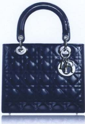
Sac en agneau matelassé noir surpiqûres « cannage ». Bijouterie lettre D I O R en métal argenté. À l'intérieur une poche zippée Dimensions : 24 x 20 x 11 cm