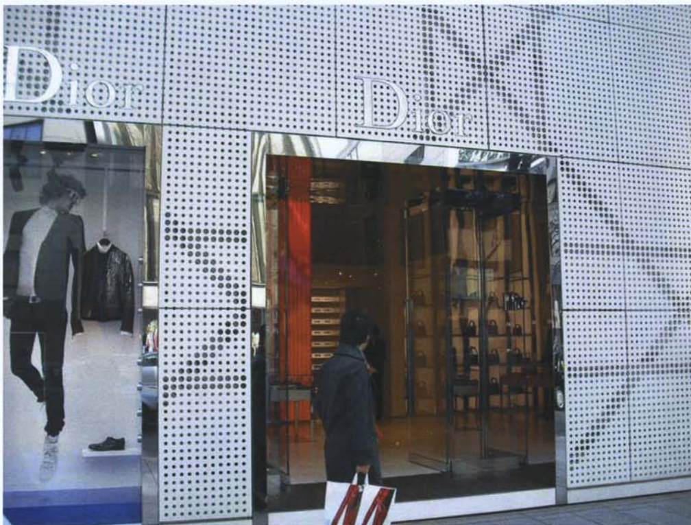
Boutique Dior Ginza à Tokyo